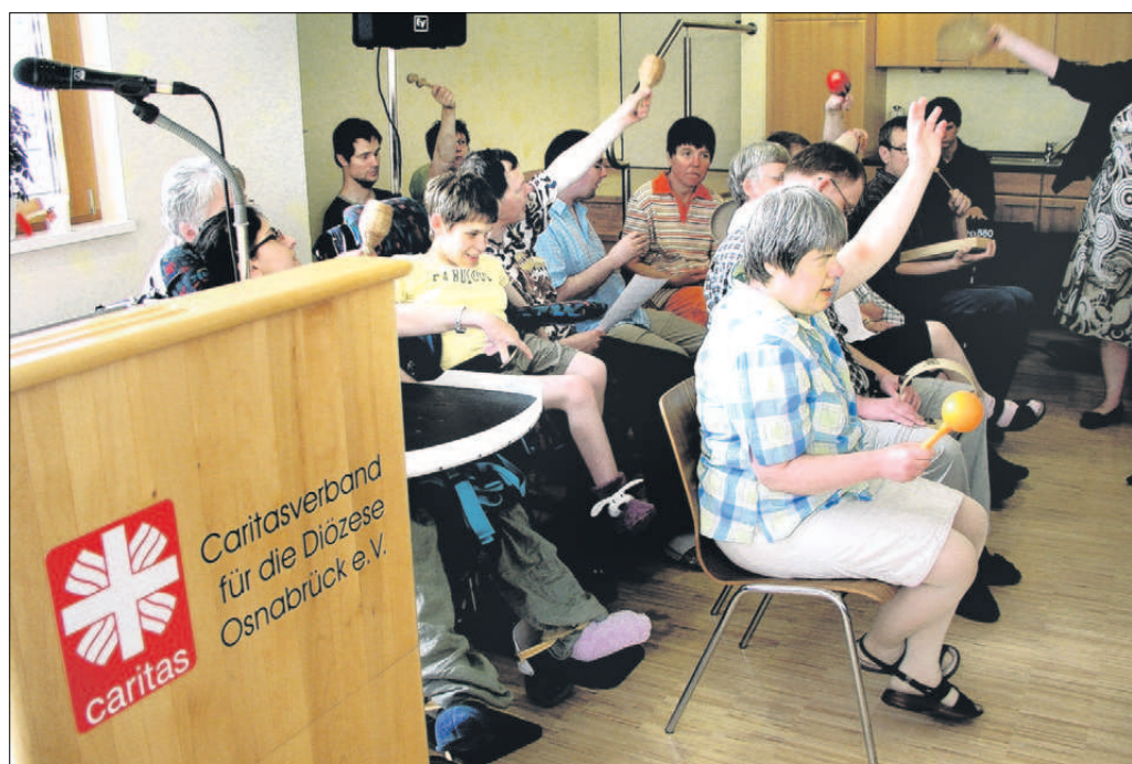
Für rhythmische Klänge beim Festakt zum 25-jährigen Bestehen des St.-Maria-Elisabeth-Hauses sorgte die Instrumentalgruppe des Hauses.

Zwischen den Festvorträgen unterhielt die Instrumentalgruppe des St.-Maria-Elisabeth-Hauses mit rhythmischen Klängen sowie der örtliche ökumenische Chor mit ansprechenden gesanglichen Darbietungen.